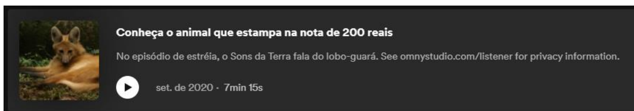
Fig 6 – episódio 1 do podcast “Sons da Terra” que fala sobre o único lobo do Brasil

A ideia aqui é que todos acessem o primeiro episódio que fala sobre o lobo-guará.