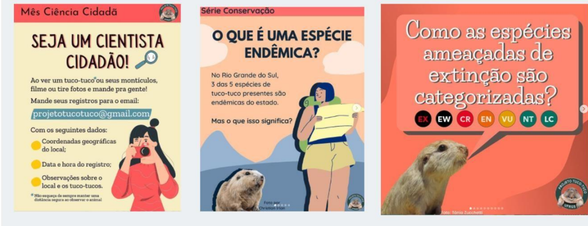
Fig 8 – modelo de posts. – Fonte: Projeto Tuco Tuco.