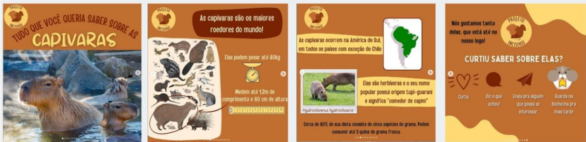
Fig 7 – modelo de carrossel 1.