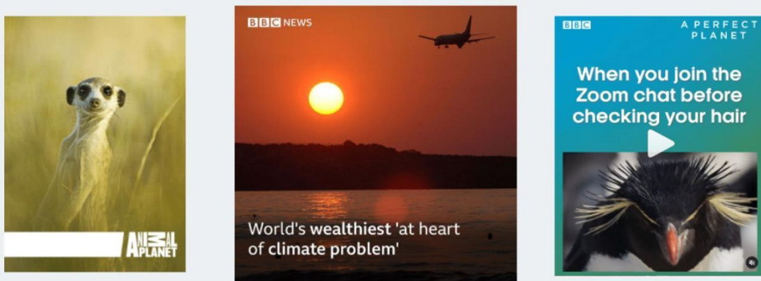
Fig 9 – modelo de posts. É possível até fazer um vídeo de até 1 minuto com legendas.